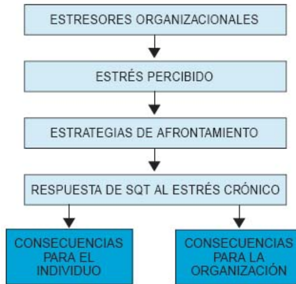
Figura 2 "Modelo de desarrollo del SQT"

En la figura 2, desde una perspectiva psicosocial, se describe de forma global un modelo explicativo del desarrollo del SQT.